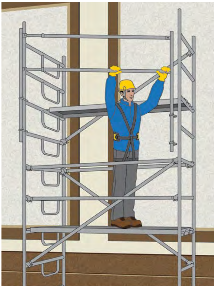
Trabattello con montaggio dal basso.

Trabattelli, che alleati ma... che rischi! Per fortuna è arrivata un'aggiornata guida Inail che spiega tipologie, definizioni e utilizzi in sicurezza. Lo scorso 28 settembre l'Istituto Nazionale Assicurazione Infortuni sul Lavoro ha pubblicato una nuova guida molto utile alle imprese di pulizia/ multiservizi/ servizi integrati che svolgono lavori in quota. Dalla definizione alla scelta, dall'impiego alla manutenzione, tutto ciò che c'è da sapere per non correre rischi.